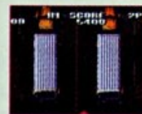
ツイントレーラー