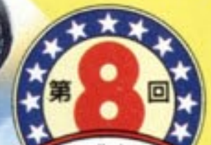
Illustration by YUJI KAIDA