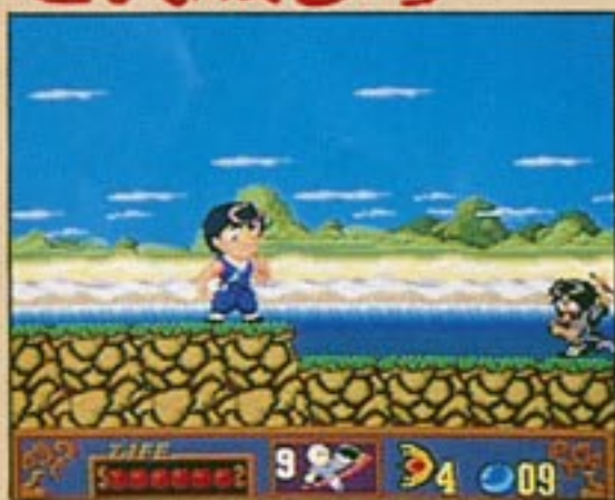
ステージ一、〈小林寺〉

ジャッキーの戦いの場となるステージは、全部で5つ。各ステージの最後にいるボスを倒すとステージクリアとなり、次のステージに進めるぞ。