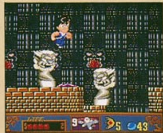
ステージ五、〈童子の部屋〉