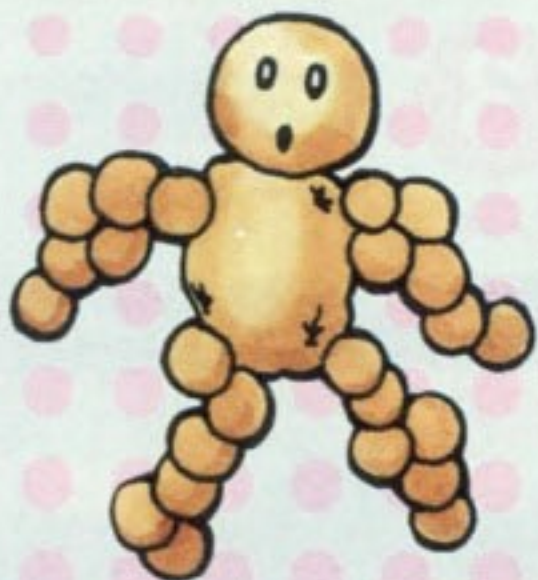
中ボス・じゃが神