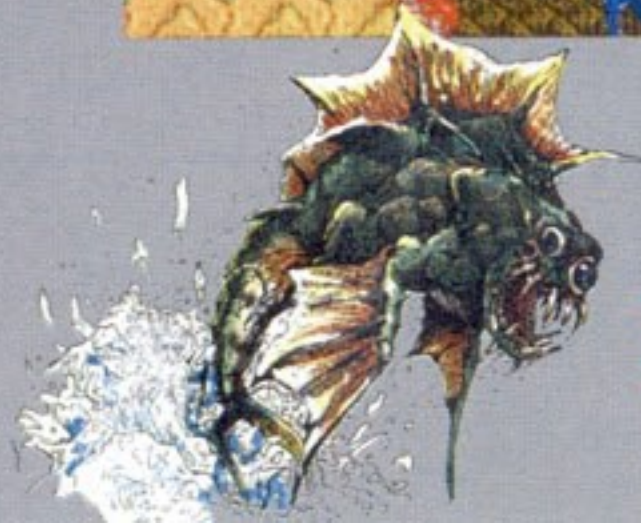
フライフィッシュ