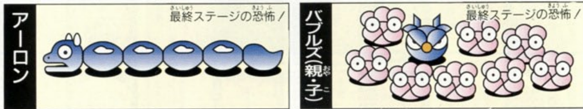
アーロン ラウンド1と3 20000点 攻略法：2ダメージを与えよ バブルズ(親子) ラウンド2と5 (親)20000点 (子)100点 攻略法：3ダメージを与えよ。親バブルズをやっつけないと 次々子バブルズを生んでいく。