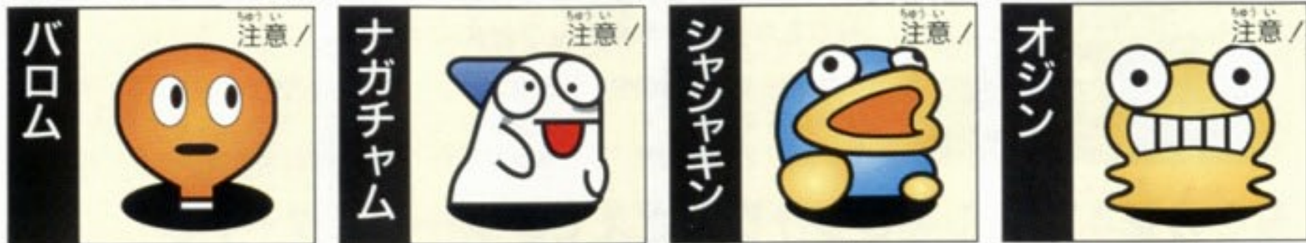
バロム ラウンド1と8 100点 ナガチャム ラウンド6 100点 シャッキン ラウンド5 400点 オジン ラウンド7 400点

敵は全部で24キャラクター。簡単にやつつけられる敵もいれば、とても手強いものまでいろいろ登場。それぞれの特長を覚えて最適な攻略法を編み出そう。ただし、各ラウンドの最終ステージに登場する敵キャラは強烈。ここで、しっかり攻略法をマスターしよう。