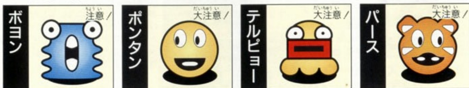
ボヨン 全ステージ 1000点 ポントン タイムアウト時に出現 こちらも快速キャラクター 200点 テルピョー 全ステージに登場 こいつもブロックを平気です り抜ける 1000点 パース 全ステージに登場 動きが思いきり速いぞ 2000点