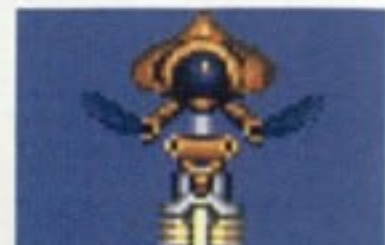
フライング・モスクマン