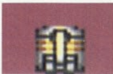
アイテムボックス

このゲームには、7種類の通常アイテムが登場します。アイテムは、すべてアイテムボックスに入っていて、ボックスを壊すことによって出現します。またアイテムボックスには、フライング・モスクマンが運んでくるタイプのももあります。