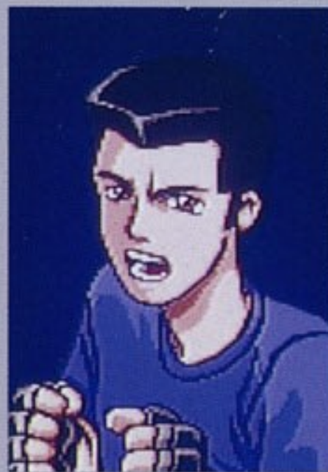
ぎんがけいじ 銀河刑事ガイバン