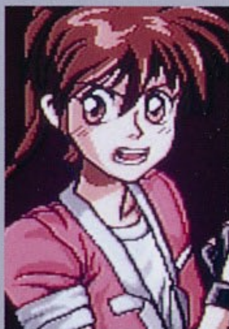
ぎんがふけい 銀河婦警ミッチ