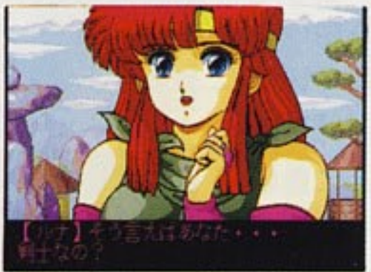
【アクアリーナ】ありがとうございます……ようやく1つめの宝玉が戻ってまいりました。